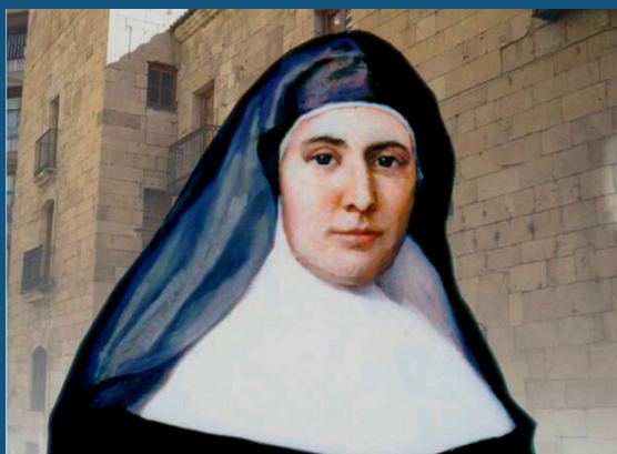
Santa Cândida, fundadora.